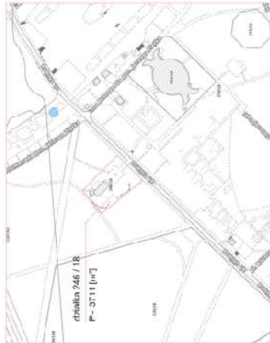
LOKALIZACJA W PLANIE PARKU